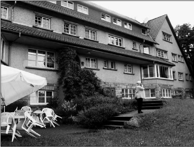
Abb. 2: Tagungshaus